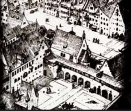
dem Sandtnerschen Stadtmodell, das die Gesamtsituation des späten 16. Jahrhunderts widerspiegelt

Der älteste Herrschaftssitz der Herzöge von Oberbayern innerhalb der Stadt München stellte sich als eigener befestigter Komplex an der Nordostecke der Stadt dar. Ein sichtbares Zeichen des latenten Misstrauens gegenüber der Bürgerstadt. Bei einem zahlenmäßig nur geringen Hofstaat (1465: 164 Personen) und bei einer immer wieder erneuten Verschuldung der Herzöge zu Lasten der Stadt ist diese räumliche Abgrenzung durchaus verständlich.