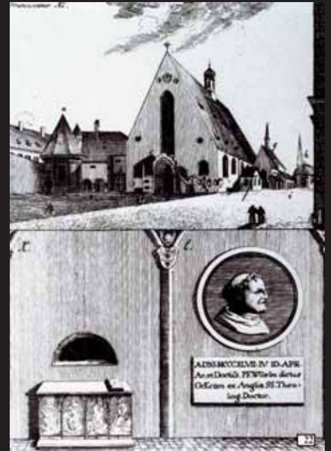
Das zweite Franziskanerkloster auf dem heutigen Max-Joseph-Platz. Im unteren Bildteil Grabdenkmal des Wilhelm v. Occam. Darstellung des 19. Jh.

chern tatkräftig unterstützt, über seinen Rivalen siegen. Der triumphale Einzug Ludwigs des Bayern in München nach der Schlacht ist auf einem großen, 1835 geschaffenen Fresko am Isartorplatz abgebildet.