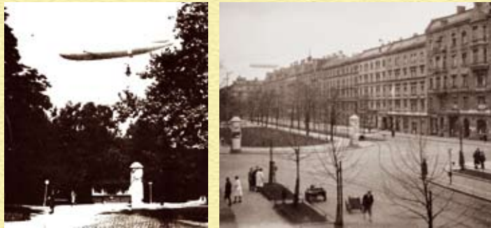
Luftschiff „Graf Zeppelin“ überfliegt München

28. September: "Kurz nach 9 Uhr vormittags kommt das neuerbaute Luftschiff 'Graf Zeppelin' auf einer Fernfahrt von Friedrichshafen nach München, überfliegt den Hauptbahnhof, wirft dort einen Briefbeutel für die Münchner Zeitung ab, zieht dann eine Schleife um die Frauenkirche, den Rathausturm und das Deutsche Museum. An Bord des Luftschiffes befinden sich dessen Führer Dr. Eckener, Reichstagspräsident Löbe, Exzellenz Oskar von Miller, die alle drei während der Fahrt über München von der Funkkabine des Zeppelins aus die Bevölkerung mit kurzen Ansprachen begrüßen. Die Straßen und Plätze der Stadt sind dichtbesetzt mit Menschen, die dem Zeppelin begeistert zujubeln."