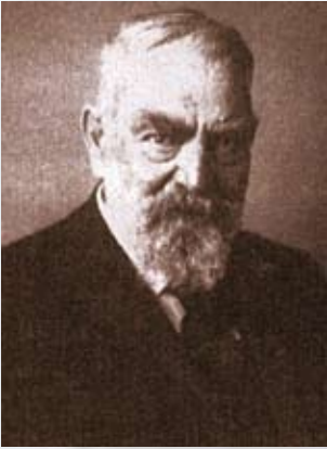
Oskar von Miller