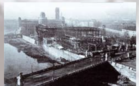
Bau des Deutschen Museums