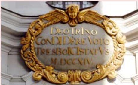
Das Chronogramm über der Türe