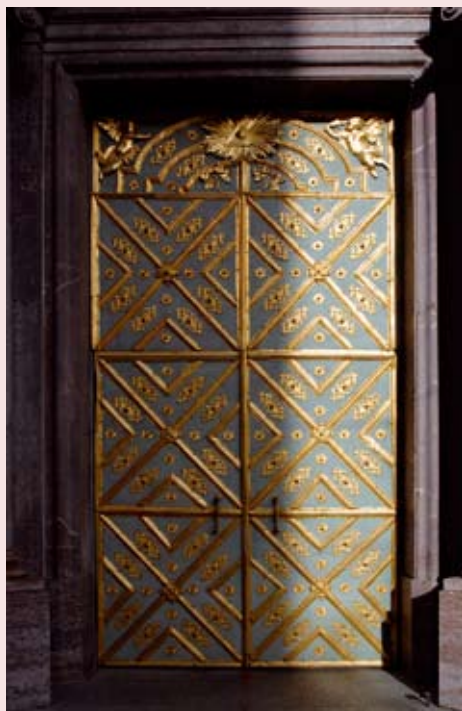
Die eisenbeschlagene, ornamentierte Türe