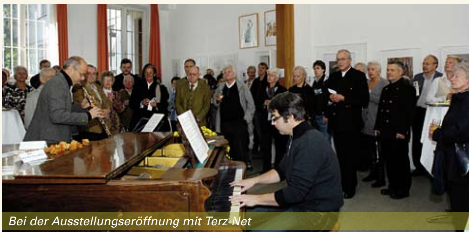
Bei der Ausstellungseröffnung mit Terz-Net

Auch eine Tombola zugunsten des Kinderhospiz durfte natürlich nicht fehlen.