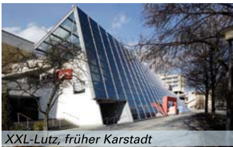
XXL-Lutz, früher Karstadt

Weihnachtszeit zwei Krippen, eine Tiroler und eine aus Spanien aufgebaut und mit ihrem Detailreichtum sehr sehenswert.