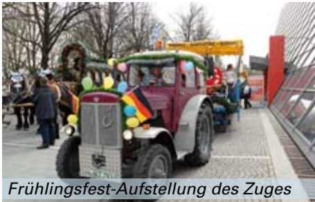
Frühlingsfest-Aufstellung des Zuges

e. V. Angrenzend das „Betongebirge“ aus gestapelten Wohnblocks mit dem „ Bavaria Brauhaus “. Neben der Auferstehungskirche befindet sich das von Theodor Fischer erbaute Ledigenheim , sowie eine ganze Reihe kleinerer Plätze, die