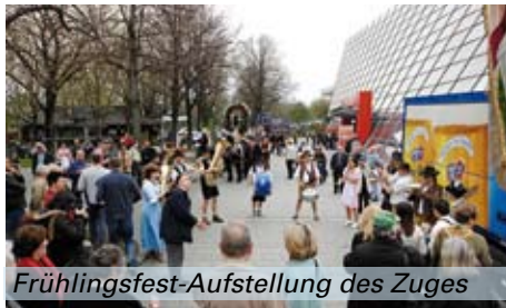
Frühlingsfest-Aufstellung des Zuges

dem Stadtteil sein Gepräge geben. Drei röm.-kath. Kirchen, St. Benedikt (1881), St. Rupert (1908 Gabriel von Seidl ) und Maria Heimsuchung (1934) und eine evang.-luth. Kirche, die Auferstehungskirche (1931 German Bestelmeyer ) prägen das Bild der Schwanthalerhöhe. In der Kirche Maria Heimsuchung sind zur