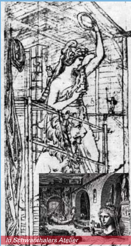
In Schwanthalers Atelier

Als Kronprinz bereits entwickelte Ludwig den Plan, in der Residenzstadt München ein patriotisches Denkmal zu errichten. 1833 schrieb Ludwig einen Wettbewerb für dieses Bauvorhaben aus. Eckdaten für das Vorhaben dieses Projektes, die Halle sollte oberhalb der Theresienwiese errichtet werden und Platz für etwa 200 Büsten bieten. Vier Teilnehmer, Friedrich von Gärtner, Joseph Daniel Ohlmüller, Friedrich Ziebland und Leo von Klenze beteiligten sich an diesem Wettbewerb. Ludwig I. entschied sich im März 1834, in erster Linie aus Kostengründen für den Vorschlag Leo von Klenzes, besonders angetan hat Ludwig beim Entwurf von Leo von Klenze die Kolossalstatue vor der Ruhmeshalle. Geschmeichelt von der Idee, eine imposante Statue zu errichten wie die antiken Herrscher, schrieb Ludwig I. nach seiner Entscheidung für Klenzes Entwurf: „Nur nero und ich können solche Kolosse erbauen“. Bereits 1824 zeichnete Klenze Ent-