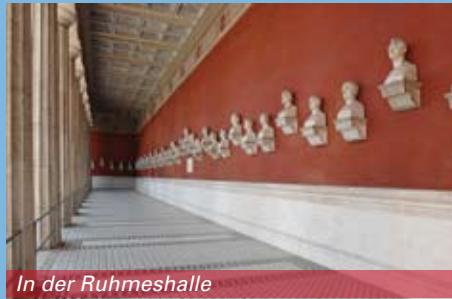
In der Ruhmeshalle

Bronze galt seit der Antike als besonders ehrwürdiges und dauerhaftes Material, daher förderte der König die Kunst der Bronze gießer. 1825 wurde die von Ludwig in Auftrag gegebene und von Klenze erbaute Königliche-Erzgießerei an der Nymphenburger Straße in Betrieb genommen.