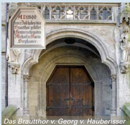
Das Brautthor v. Georg v. Hauberrisser

St. Paul steht am westlichen Ende der Landwehrstraße, die neben der Schwanthalerstraße eine der großen Erschließungsstraßen der Ludwigsvorstadt war. Die Paulskirche schließt die Landwehrstraße ab und zieht den Blick auf sich, da sie durch ihren Hauptturm die Sichtachse beherrscht und somit die Ludwigsvorstadt um sich versammelt. Gleichzei-