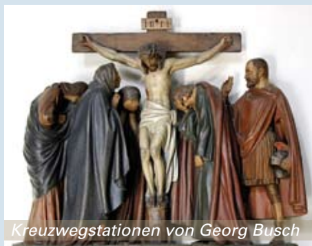
Kreuzwegstationen von Georg Busch

ser errichten sollte. Neben dem Zentralkirchenbauverein wurde 1883 zusätzlich ein lokaler Kirchenbauverein für St. Paul gegründet, der bis 1914 bestand.