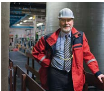
Handwerker und Gewerbetreibende wissen den Service der Münchner Bank zu schätzen.

Staatliche Konjunktur- und Förderprogramme helfen Mittelständlern ebenfalls weiter. Fördermittel des Bundes, der Länder und der Förderbanken gibt es für beinahe jede betriebliche Investition. Meist handelt es sich um zinsgünstige Kredite mit längeren Laufzeiten. Gut zu wissen: Fehlende Sicherheiten können in vielen Fällen durch Haftungsfreistellungen oder Ausfallbürgschaften ersetzt werden. Solche öffentlichen Fördermittel vergibt in der Regel die Hausbank. Die Firmenkundenbetreuer der Münchner Bank sind also die richtigen Ansprechpartner. Sie informieren über die Fördermöglichkeiten und leiten den ausgefüllten Antrag an die zuständige Stelle weiter. Das Geld ist da, man muss es nur abrufen!