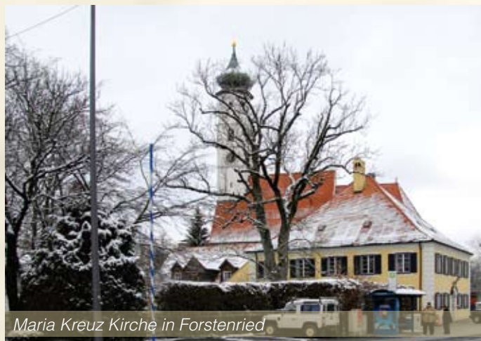
Maria Kreuz Kirche in Forstenried

Forstenried , dieser Stadtteil mit noch relativ gut erhaltenem alten Dorfkern besteht überwiegend aus Wohngebieten. Er wurde erstmals im Jahr 1166 als Uorstersriet erwähnt, der Name setzt sich zusammen aus den Wörtern Uorst für Forst, Wald und Ried für Rodung. Der alte Ortskern lag um die Pfarrkirche Heilig Kreuz.