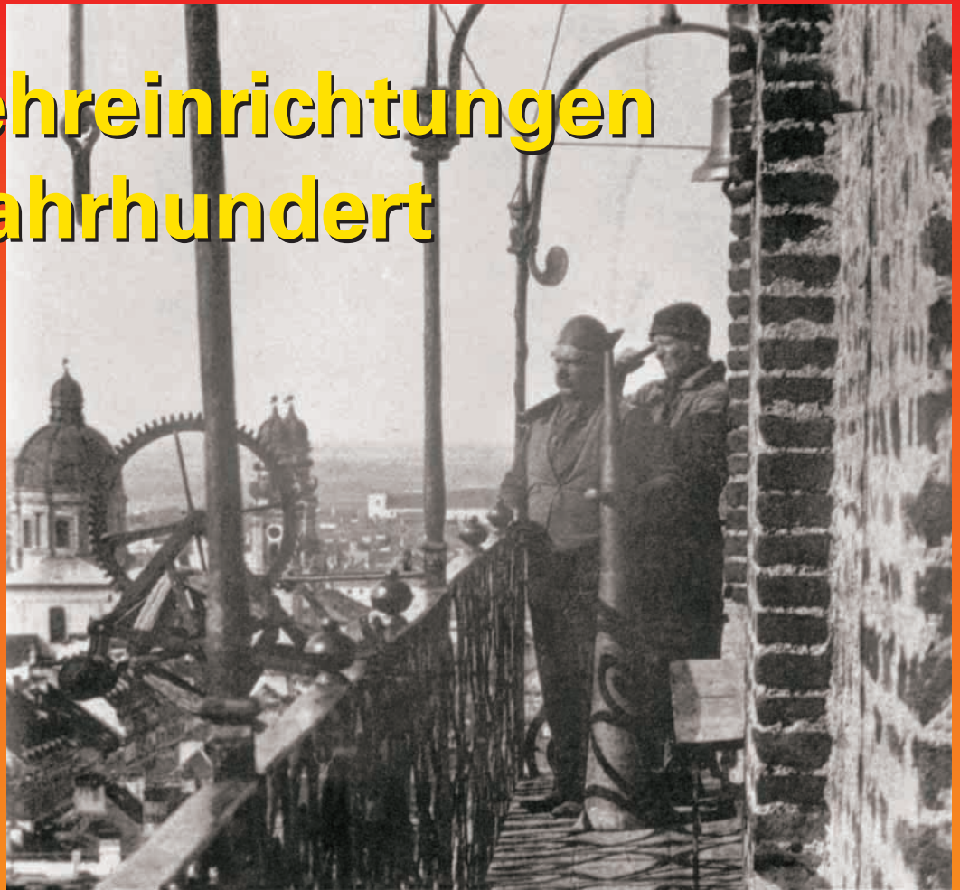
Die Feuerwächter auf dem Turm der Peterskirche, um 1865.

Wurde ein Brand bemerkt, alarmierten sie durch Glockenzeichen, durch lautes Rufen mit einem Sprachrohr und durch Ausstecken von Fahnen oder Laternen die Feuerwehr. Zum 1. November 1901 wurde die Feuerwache auf dem Turm der Peterskirche eingestellt. Damit endete ein jahrhundertlang praktiziertes Alarmsystem.