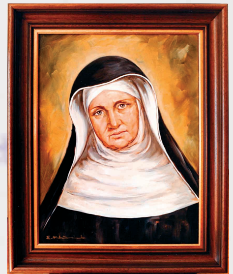
Ordensmutter Theresia Gerhardinger

1843 übernahm Maria Theresia Gerhardinger, die Gründerin der Armen Schulschwestern von Unserer Lieben Frau das Konventgebäude und die Kirche. Dies geschah auf Vermittlung von König Ludwig I. Im Jahr 1855 konnte der Orden das Areal günstig kaufen. Bereits 1839 hatten sich die Schulschwestern in der Vorstadt Au niedergelassen. Das neue Kloster in der Haupt- und Residenzstadt München wurde Sitz für das bayerische