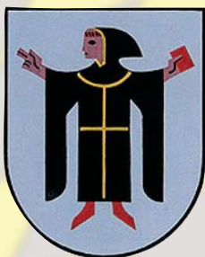
Großes Stadtwappen, geführt seit 1957.

Neben dem im Dienstgebrauch üblichen "Kleinen Stadtsiegel" führt die Landeshauptstadt auch das so genannte "Große Stadtsiegel", das allerdings nur bei feierlichen Anlässen und auf Einladungskarten der Stadtspitze Verwendung findet. Dieses zeigt den Stadtmönch in einem geöffneten, von zwei Türmen flankierten Stadttor, über dem mittig ein steigender Löwe erscheint. Die hier angewandte heraldische Kombination ist auf Siegelabbildungen von 1313/1323 zurückzuführen, hinter denen wiederum das "Ursiegel" Münchens aus dem Jahr 1239 aufscheint. Schon damals erschien in einem geöffneten Stadttor der für den Stadtnamen "redende" Mönchskopf (mit übergezogener Kapuze). Allerdings zeigte sich 1239 über dem Stadttor noch ein auffliegender Adler, der auf die Situation des von Freising verwalteten Reichskirchengutes München hinwies. Das Haus Wittelsbach, das seit der Mitte des 13. Jahrhunderts die Stadt München unter seine völlige Kontrolle gebracht und entscheidend erweitert hatte, ersetzte den Adler seit 1313 durch sein eigenes Wappenbild, den Löwen.