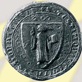
"Kleines" Stadtsiegel, ab 1304

Zum 700. Jubiläum des städtischen Dienstsiegels