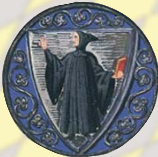
Kleines Stadtwappen, 1835-1865

Seit dem Jahr 1304 benutzt die Münchner Stadtverwaltung für ihre normalen Beurkundungen und Beglaubigungen ein Dienstsiegel, das die heraldischen "Grundbestandteile" der Münchner Entwicklungsgeschichte in vereinfachter und graphisch besonders überzeugender Weise zur Darstellung bringt. Es handelt sich um ein Siegelbild mit der umlaufenden Beschriftung "Sigillum testimonii civitatis Monacensis" - Beglaubigungssiegel der Stadt München. Der für den Stadtnamen München "redende", nach rechts blickende Mönch (mhd. "munich") ist in einen Dreiecksschild gesetzt, den er durch Gestik und Kleidung in idealer Weise ausfüllt. Der Mönch hat seine rechte Hand zum Segensgestus erhoben, in der linken Hand hält er das Evangelienbuch.