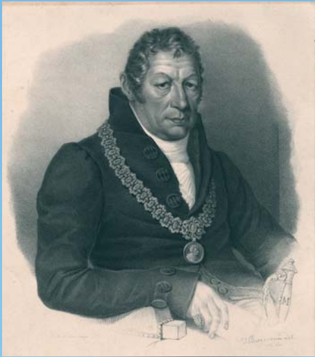
Franz Paul von Mittermayr

Franz Paul Joseph Mittermayr, ab 1792 Edler von Mittermayr (* 2. April 1766 in München; † 6. Juli 1836 in München), Rechtslizenziat (Lic.jur., Lehrberechtigung), war königlich bayerischer Kommunaladministrator und Erster Bürgermeister von München. Erhebung in den Reichsadelstand durch Kurfürst Karl Theodor von Pfalzbayern mit "Edler von Mittermayr" in München am 4. Juli 1792. Immatrikulation im Königreich Bayern bei der Adelsklasse am 30. Juni 1809.